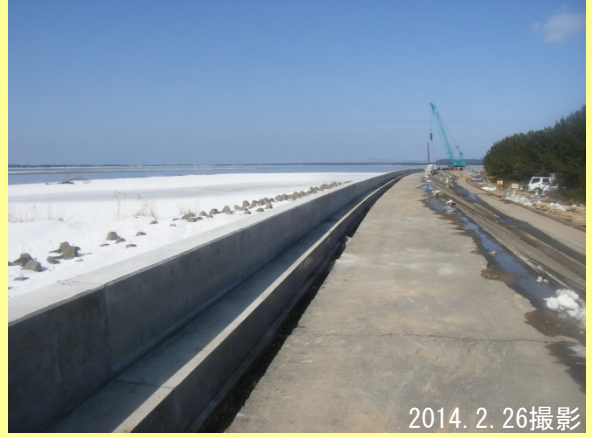
2014. 2. 26撮影