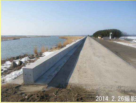
2014. 2. 26撮影